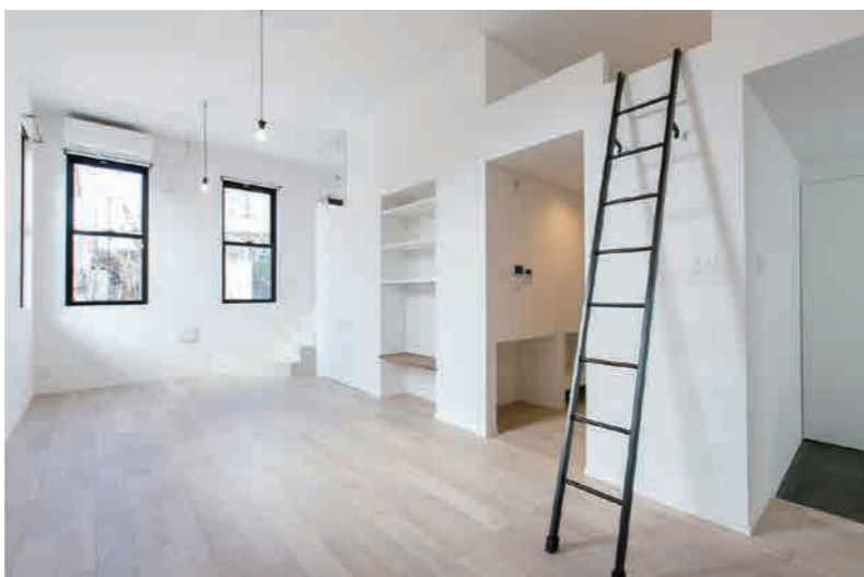
トイレは海外ホテルのようなクラシカルなフォルムをあえて採用。洗練された室内は収納も充実。ロフトも備わっており、奥の階段は水まわりにつながる