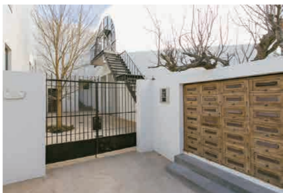
木製の郵便受けは、昔イギリスでオフィスのレターボックスとして使用されていたものを再生した。中庭に面した扉は、100年前のヨーロッパ製